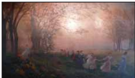
Ronde de jeunes filles ou Les Jeux de l'enfance et de la jeunesse, 1905