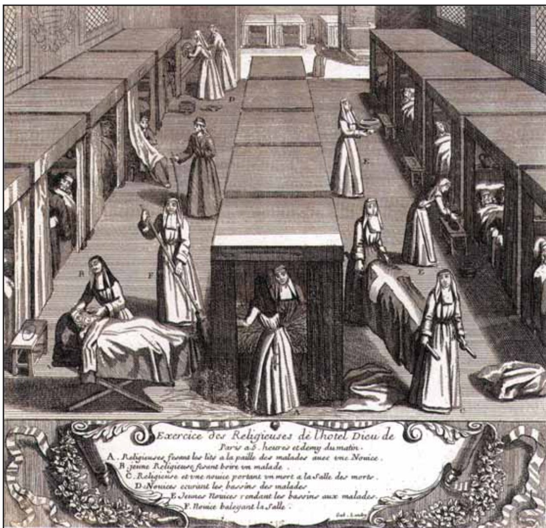
Exercice des Religieuses de l'hôtel Dieu de Paris à 5 h et demie du matin