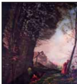
Le Martin-Pêcheur, 1919