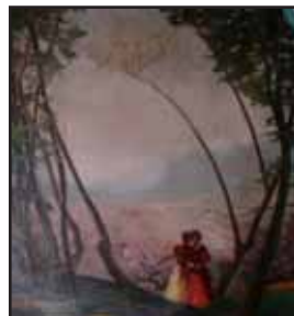
Le Nid, 1919